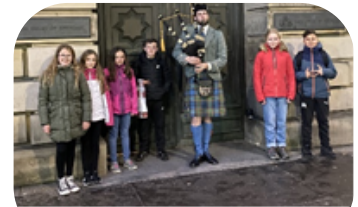
Joueur de cornemuse