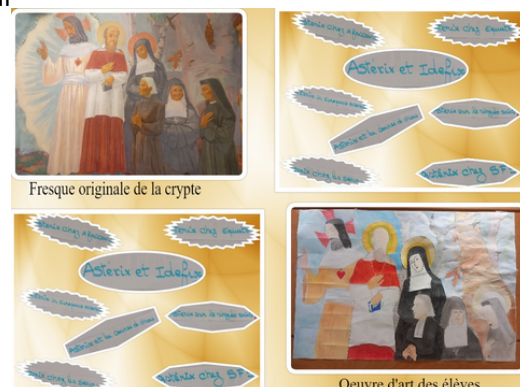
Fresque originale de la crypte