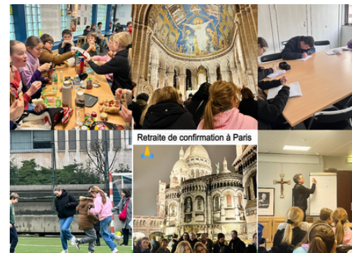
Retraite de confirmation à Paris

Enfin, le 24 janvier, les élèves ont vécu un rallye salésien avec pour thème : Astérix aux olympiades salésiennes. La matinée de ce mercredi 24 a été banalisée pour permettre aux élèves et à toute l'équipe de voyager sur place pour découvrir quelques héritages de la spiritualité salésienne et surtout pour connaître davantage la vie et les apostolats des Soeurs. En 8 équipes d'environ 18 élèves de la 6ème à la terminale et encadrés par un professeur, les élèves sont allés sur divers lieux de rencontre pour en savoir plus sur la vie des Soeurs. Les 8 rencontres proposées sont les suivantes : visite de la communauté des Soeurs ; témoignage de vie en Afrique du Sud, témoignage de vie en Amérique latine, histoire d'une vocation, explication de la croix des Soeurs, témoignage de la vie missionnaire des Soeurs d'Europe, un parcours du combattant, des jeux, énigmes et devinettes pour détendre l'atmosphère. Nous avons terminé cette matinée par une messe d'action de grâce animée par les élèves à la chapelle de Notre-Dame du Bon Conseil.