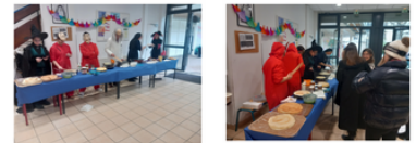
DÉLICES DE CRÊPES