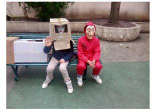
MYSTÈRES DE DÉGUISSEMENTS